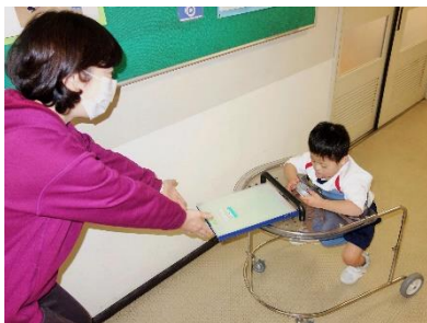
録音ボタンでほけん係