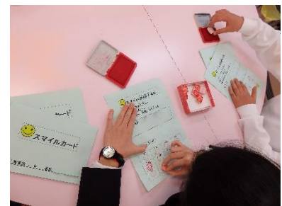
スマイルもあと1回

一斉臨時休業からはじまった今年度は、保護者の皆様と共に、これまで以上にお子様の健康・安全を第一に考えながら過ごした一年でした。保健給食関係でも、多くのご理解とご協力をいただきましたことに心より御礼申し上げます。次年度も引き続き感染症予防に努めてまいります。どうぞよろしくお願いいたします。